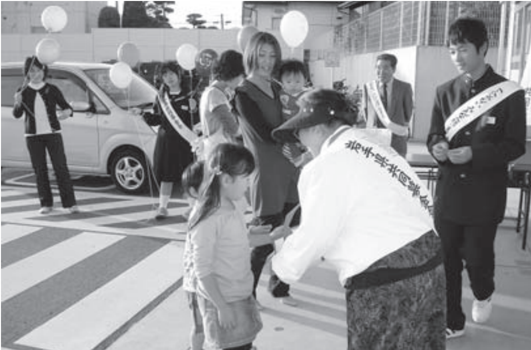
▲お寄せいただいた募金は、誰もが安心して暮らせる地域づくりに役立てられます。

十月一日から赤い羽根共同募金運動が全国一斉に始まります。この運動で寄せられる募金は、私たちの地域で行う「福祉のまちづくり」の貴重な財源として活用されます。今年度も、皆様のあたたかいご理解・ご協力を賜りますよう、宜しくお願いいたします。