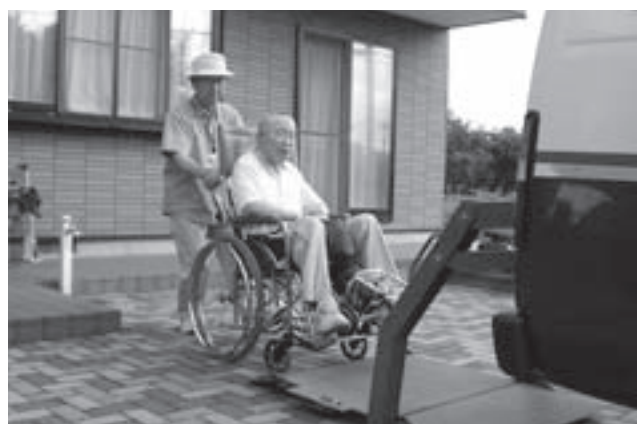
▲「ふれあい送迎サービス」。リフト付車両を運行し車椅子利用者の方の外出のお手伝いをしています。