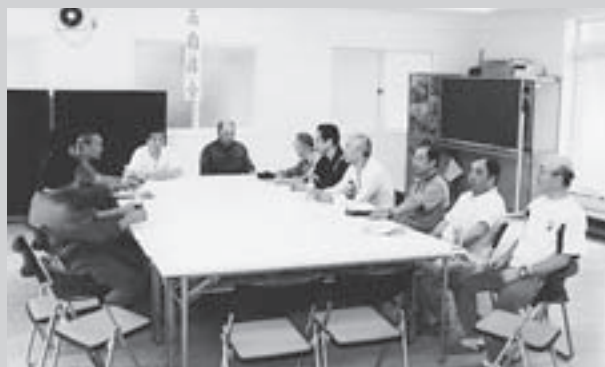
▲元村中央自治会様の会議風景。皆様の善意により、集会所内の老朽化したイス・テーブルを一新することができました。