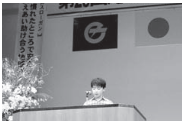
▲「福祉作文コンクール」。児童生徒の社会福祉への理解と関心を高め、地域福祉活動に参加する意識を啓発・育成することを目的に実施しております。