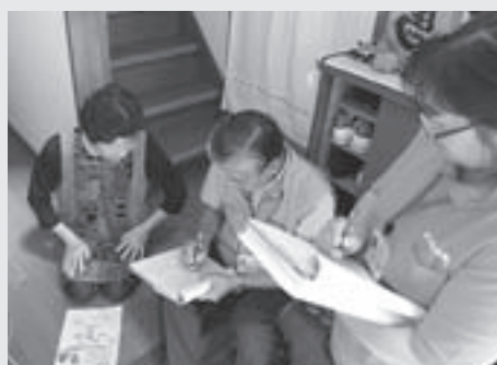
▲避難されている方のお宅を訪問して、被災時の状況や現在の生活の様子などをお聞きます。

避難生活を送っている方は、突然発生した大地震により長年住み慣れた故郷を離れた生活を余儀なくされています。 慣れない滝沢村での生活に戸惑いながら、現在そして将来に対する不安や悩みを抱えて暮らしている方も少なくありません。 滝沢村社会福祉協議会では、生活支援相談員の活動を通して、行政、関係機関と連携を図りつつ避難している方々への復興支援に取り組んでまいります。村民の皆さまのご支援とご協力をよろしく願います。