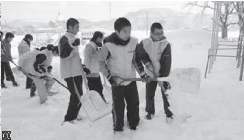
③ ① ④ ②