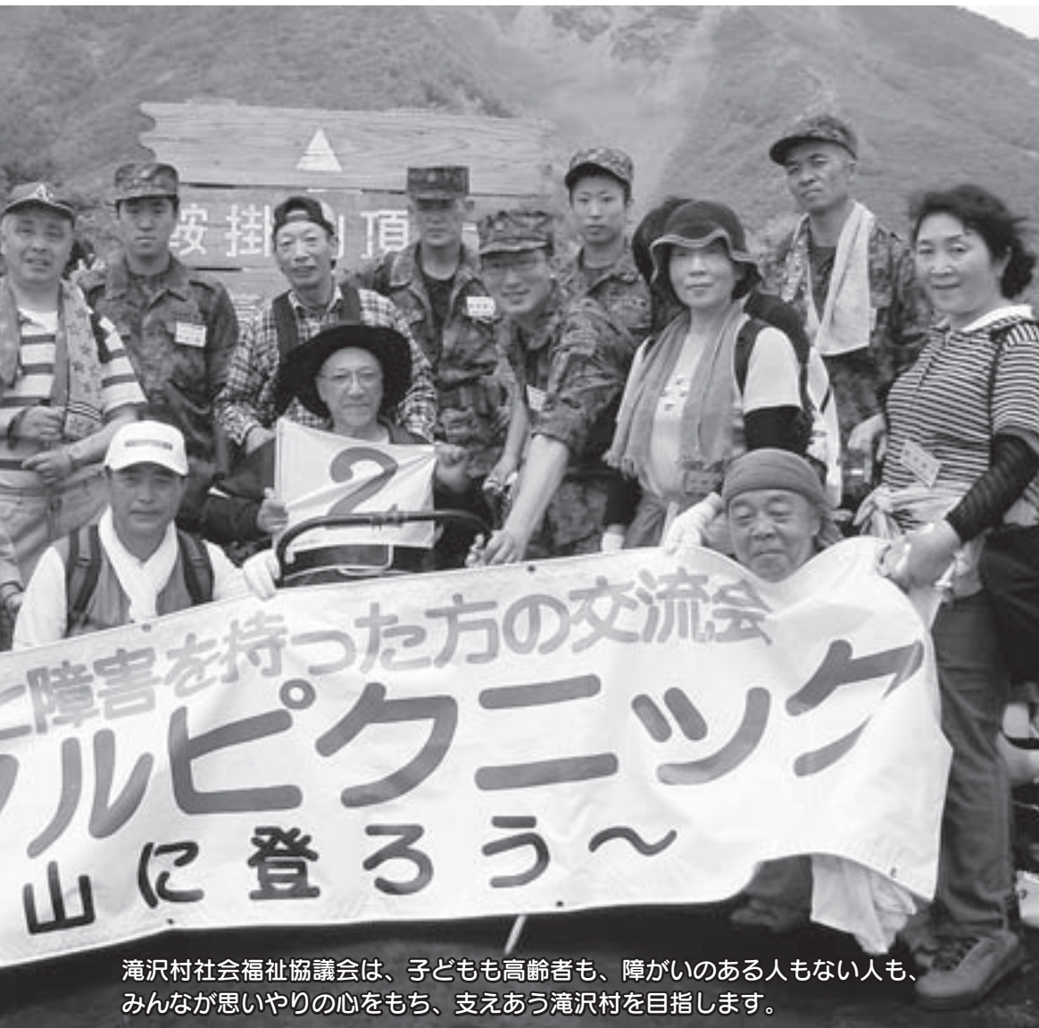
滝沢村社会福祉協議会は、子どもも高齢者も、障がいのある人もない人も、みんなが思いやりの心を持ち、支えあう滝沢村を目指します。

平成22年3月25日に開催いたしました評議員会において、平成22年度事業計画・予算が決定いたしました。滝沢村社会福祉協議会では、「住み慣れたところで誰もが安心して暮らすことができる地域づくり」に向けて、役員一丸となって努力をする所存ですので、村民の皆様への暖かいご支援・ご協力を賜りますようお願いいたします。