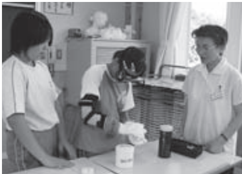
▶ キャップハンディ体験（障がい疑似体験）の指導