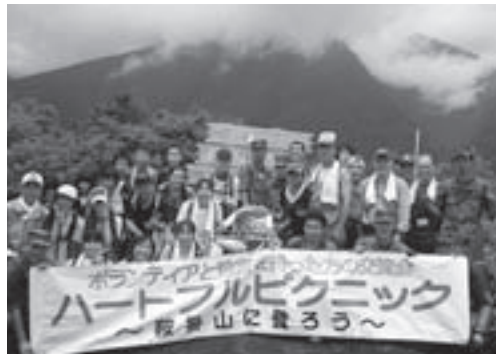
▶ ハートフルピクニック