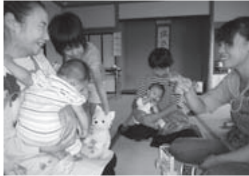
▶ 婦人病検診託児ボランティア