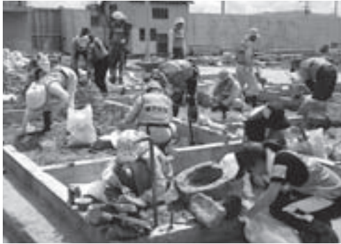
▶ 山田町でのガレキ除去作業