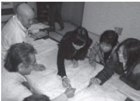
▶ 住民支え合いマップ作成

平成23年度の滝沢村社会福祉協議会は、理念・使命である「誰もが安心して暮らすことのできる福祉のまちづくり」に向けて、近隣同士の支え合いや助け合いが推進されるよう各種事業を実施しました。