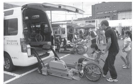
リフト付福祉車両への乗車体験

あんずの会、岩手大宮会、滝沢市民生児童委員連絡協議会、滝沢市地域婦人協議会、大沢なごみの会、カフェ・ド・グリグリ、大釜保育園、滝沢市食生活改善推進員連絡協議会、みたけの園、みやま会（みやま寮、支援センター滝沢）、カッコウの会、ワーク小田工房、滝沢市手をつなぐ育成会、りんりん舎、国立岩手山青少年交流の家、滝沢市母子寡婦福祉協会、滝沢市身体障害者福祉協会、みのりホーム、手話サークルわすれな草、滝沢朗読ボランティアサークルこだま、社会福祉法人滝沢市保育協会、社会福祉法人麗澤会、滝沢市民生児童委員OB会、滝沢市人権擁護委員、滝沢市老人クラブ連合会、滝沢市保健推進員協議会、滝沢市保護司協議会、岩手八幡平歯科医師会、滝沢市シルバー人材センター、滝沢市睦大学、滝沢市役所、滝沢市商工会、滝沢市ファミリー・サポート・センター、滝沢市茶道協会、NPO法人元気岩手応援隊、日本赤十字社岩手県支部滝沢市地区、滝沢市立鶴飼小学校吹奏楽団、柳沢保育園、鶴飼保育園、滝沢市さんさ踊り保存会、滝沢市運動普及推進員、東林寺、清雲院、滝沢市社会福祉協議会（順不同）