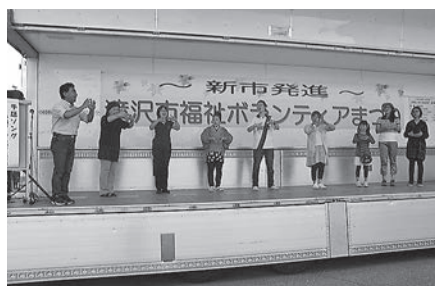
手話サークルわすれな草「手話ソング」