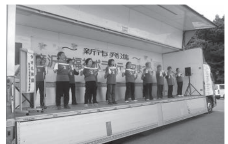
滝沢市運動普及推進員「タオル体操」