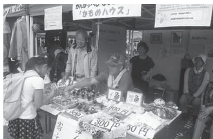
被災者有志「かもめハウス」

滝沢市母子寡婦福祉協会の皆さんによる「もちまぎ大会」。今年も多数のご来場者でにぎわいました。