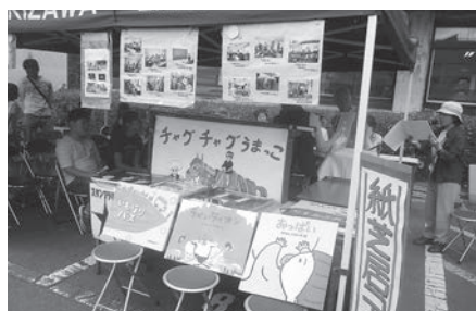
朗読ボランティアサークルこだま「紙芝居」

福祉ボランティアまつりは、今年で13回目を数えました。事前準備をはじめ、延べ600人のボランティアが参加しました。 晴天に恵まれた当日は福祉団体や睦大学学生によるステージ発表や、軽食の販売、呈茶や木工キーホルダー作製の体験など各コーナーを運営し、一体となって、まつりを作り上げました。 このうち、東日本大震災により被災した方々が有志で取り組んだ「かもめハウス」では手作りの手芸品を展示・即売しました。得た売上金（19,750円）については、8月に発生した広島県大雨災害義援金として全額寄附されました。