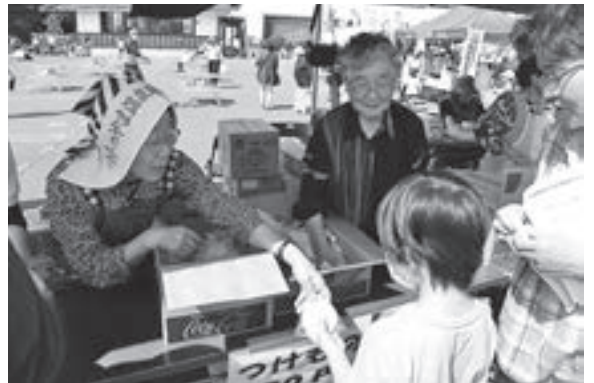
母子寡婦福祉協会の会員の方による手作りのおもちを求めて長い列ができました。

本事業の開催にあたり、たくさんのボランティアの方に看板作製や配布チラシの準備、テントの設営・撤去、各コーナーへの従事等、多大なるご協力をいただきました。