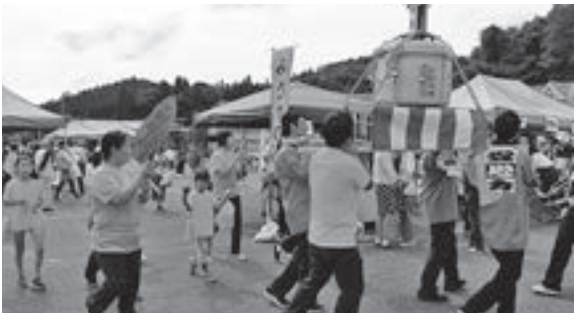
社会福祉法人麗沢会さんのおみこしがまつりの雰囲気を感じ上げます。

フライングディスクは誰でも楽しめるニユースポーツです。体験コーナーでは、子どもから大人まで楽しみました。