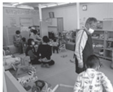
▲ ボランティア活動拠点「スマイルすまいる」では毎週親子サロンを開催しています。