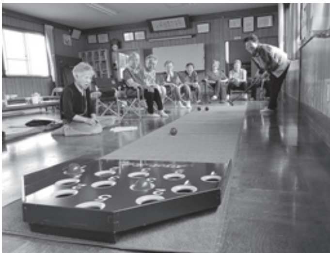
この日はスカットボールで盛り上がりました。