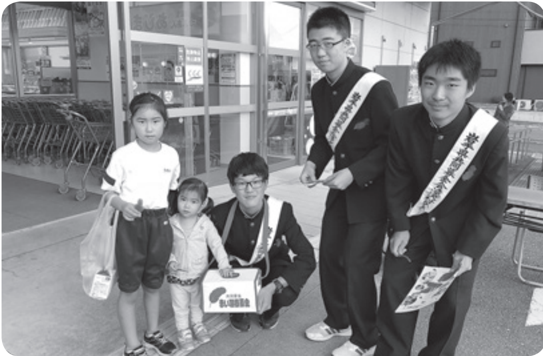
▲ お寄せいただいた募金は、誰もが安心して暮らせる地域づくりに役立てられます。

「赤い羽根共同募金運動」は昭和22年に住民主体の取り組みとして始まりました。この運動でお寄せいただいた募金は、私たちの地域で行う「福祉のまちづくり」の貴重な財源として活用されています。 厳しい社会情勢が続いておりますが、本年度も皆様の温かいご理解・ご協力を賜りますよう、よろしくお願いいたします。