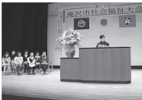
▲ 社会福祉大会にて福祉作文コンクール最優秀作品の発表を行います。