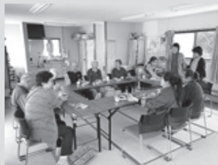
▲ ボランティアグループゆいっこ。イスとテーブルの整備により会員がより参加しやすくなりました！