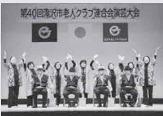
スコップ三味線を披露した長寿会

滝沢市内の各老人クラブでは、会員の趣向に合わせて、歌や踊りの他、軽運動（輪投げ、ボッチャ）、旅行など幅広く活動に取り組んでいます。一緒に活動されたい方は、市老人クラブ連合会事務局（電話684-1110）までお問い合わせください。