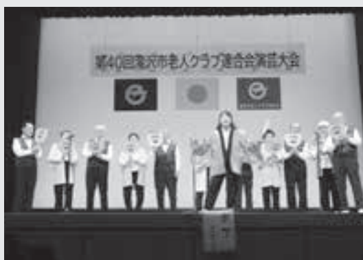
会場が笑いで包まれる発表をした上寿会