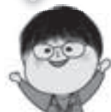
赤石コーディネーター