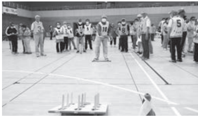
【写真】大釜会 対 老盛会のひとコマ

仲間を鼓舞する応援団の声を背に受け、選手は一投一投に力が入ります。個人の部は、同点決勝が行われるなど、全てのコートで激戦が繰り広げられる一日となりました。大会の結果は次の通りです。