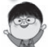
赤石コーディネーター