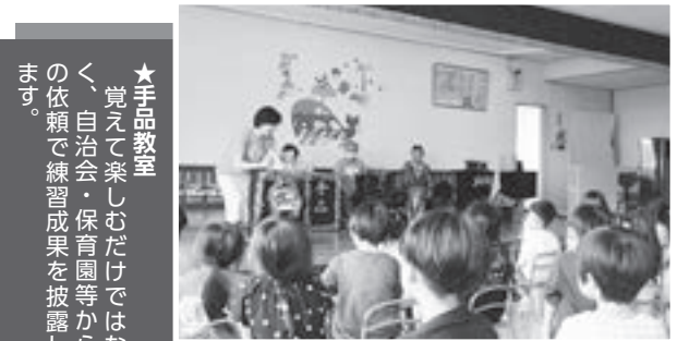
★手品教室 覚えて楽しむだけでなく、自治会・保育園等からの依頼で練習成果を披露します。