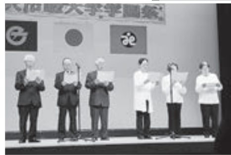
★詩吟教室 古今の名詩に触れて、腹式呼吸と正しい姿勢で、頭もスッキリ、心もリフレッシュしましょう。